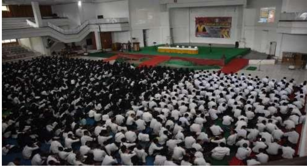
Gambar 4.1 Pendidikan karakter mahasiswa baru